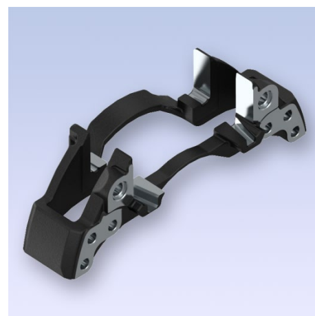
Support de frein PAN™ 17

Les freins PAN™ 17 sont des freins à disque pneumatiques très fréquemment utilisés sur les petits véhicules industriels et les bus de différentes marques, comme par ex. DAF/Paccar, MAN, Iveco, Otocar, Ashok Leyland, Alexander Dennis, Albion, Gigant et bien d'autres. Rien que dans les 5 dernières années, WABCO a vendu 350.000 applications aux constructeurs de véhicules (équipementiers d'origine).