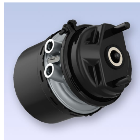
Cilindros de freno Tristop™ de WABCO

Así, WABCO ofrece para los más de 900 000 cilindros de freno del mercado una solución "Plug and Play" competitiva a la medida de las necesidades de nuestros clientes.