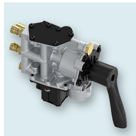
Nueva válvula WABCO con TASC