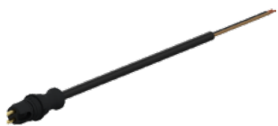
Priključak s kabelom