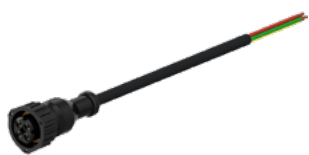
Kabel s utičnicom